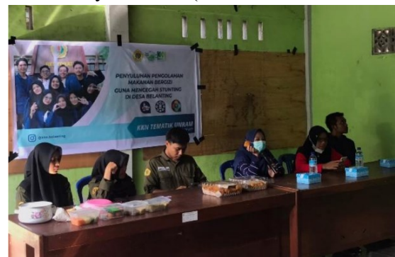
Gambar 2. Pemaparan materi tentang stunting dan gizi seimbang oleh ahli gizi Puskesmas Belanting

materi tentang faktor yang dapat menyebabkan stunting, dampak stunting, ciri-ciri stunting, dan cara pencegahan stunting. Stunting dipengaruhi oleh berbagai faktor antara lain kurangnya pengetahuan ibu mengenai kesehatan, gizi sebelum dan pada masa kehamilan, serta setelah melahirkan. Selain itu faktor penyebab stunting adalah faktor ekonomi, kurangnya akses air bersih, sanitasi (TNP2K, 2017), pernikahan dini, berat bayi lahir rendah (BBLR), dan inisiasi menyusui dini (Windasari, dkk., 2020).