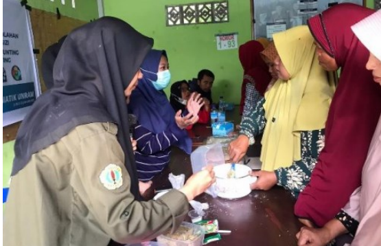
Gambar 3. Demonstrasi pembuatan nugget empat bintang.

Makanan-makanan bergizi untuk mencegah stunting, yaitu biasanya disebut menu 4 bintang (menu lengkap) yang meliputi protein hewani (daging, ikan, telur, susu, dll.), protein nabati (tahu, tempe, kacang-kacangan, biji-bijian, dll.), vitamin dan mineral (buah-buahan, sayur-sayuran, dll.), serta karbohidrat (nasi, kentang, ubi, jagung dll.) (Aprianti, 2019).