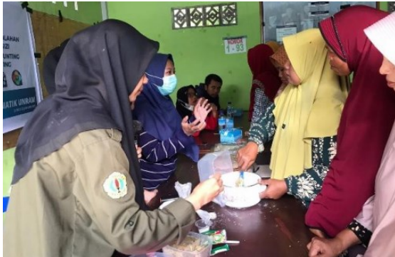
Gambar 3. Demonstrasi pembuatan nugget empat bintang.

Makanan-makanan bergizi untuk mencegah stunting, yaitu biasanya disebut menu 4 bintang (menu lengkap) yang meliputi protein hewani (daging, ikan, telur, susu, dll.), protein nabati (tahu, tempe, kacang-kacangan, biji-bijian, dll.), vitamin dan mineral (buah-buahan, sayur-sayuran, dll.), serta karbohidrat (nasi, kentang, ubi, jagung dll.) (Aprianti, 2019).