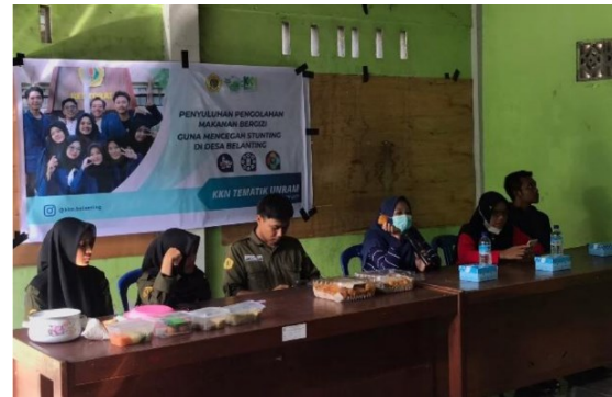
Gambar 2. Pemaparan materi tentang stunting dan gizi seimbang oleh ahli gizi Puskesmas Belanting

materi tentang faktor yang dapat menyebabkan stunting, dampak stunting, ciri-ciri stunting, dan cara pencegahan stunting. Stunting dipengaruhi oleh berbagai faktor antara lain kurangnya pengetahuan ibu mengenai kesehatan, gizi sebelum dan pada masa kehamilan, serta setelah melahirkan. Selain itu faktor penyebab stunting adalah faktor ekonomi, kurangnya akses air bersih, sanitasi (TNP2K, 2017), pernikahan dini, berat bayi lahir rendah (BBLR), dan inisiasi menyusui dini (Windasari, dkk., 2020).