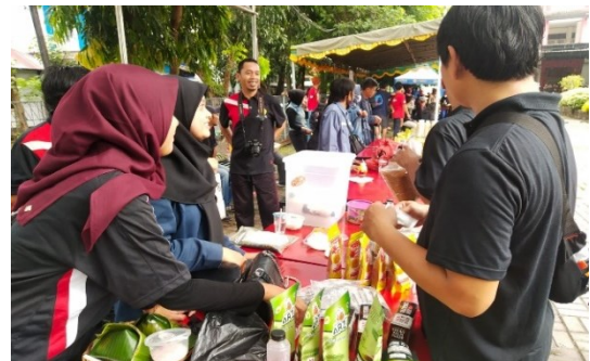
Gambar 3. Pelaksanaan kegiatan promosi produk gula aren

( https://eni-store.berdu.pw/Kekait_palm_sugar ) sehingga hal tersebut bisa dikelola dengan baik oleh para pelaku dan memudahkan pelaku menjual barangnya melalui online. Pada kesempatan yang sama juga KKN Tematik unram mempromosikan produk UMKM Desa Kekait melalui bazar disetiap event yang ada dikota mataram, mempromosikan produk pada kerabat serta membantu mempromosikan produk di acara Car Free day Udayana yang dapat dilihat pada Gambar 3.