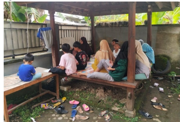
Gambar 7. Pelaksanaan kegiatan bimbingan belajar yang terlaksana di Posko.

Mahasiswa KKN Tematik Unram mengadakan program kerja bimbingan belajar gratis di Desa Kekait yang terlaksana di Posko KKN seperti pada Gambar 7. Harapannya agar anak-anak tetap semangat belajar dan menambah wawasan dan untuk menambah pengetahuan. Ilmu yang sekiranya belum didapat atau belum diajarkan di sekolah bahkan dengan mengikuti bimbingan belajar itu sendiri anak mampu berprestasi di sekolah. Hal tersebut menyiratkan bahwa bimbingan belajar memiliki nilai positif dan manfaat tersendiri bagi anak-anak.