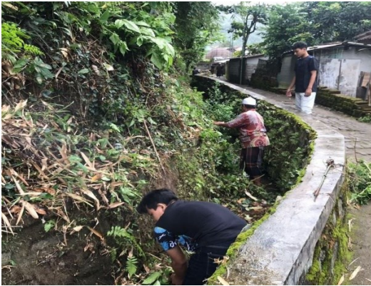
Gambar 5. Pelaksanaan kegiatan gotong royong bersih-bersih desa bersama masyarakat

Kegiatan ini dilakukan dengan tujuan untuk memperindah lingkungan masyarakat Kekait dan membuat desa terlihat lebih bersih sehingga dapat terhindar dari serangan penyakit. Setelah dilakukannya gotong royong di Desa Kekait diharapkan masyarakat menyadari pentingnya akan kebersihan demi kenyamanan dan kesehatan. Kegiatan ini dilakukan oleh seluruh anggota kelompok KKN dan dibantu oleh masyarakat Kekait setempat sebagaimana yang disajikan pada Gambar 5.