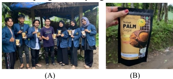
Gambar 2. (a) Penyerahan kemasan yang sudah dimodifikasi oleh KKN Tematik Unram kepada pelaku UMKM, (b) kemasan gula aren yang sudah dimodifikasi

Modifikasi yang dilakukan berupa modifikasi pada kemasan dan label. KKN Tematik Unram memberikan ide untuk membuat kemasan yang berbentuk standing pouch dan tahan air seperti pada Gambar 2. Berdasarkan arahan dari Dinas Perindustrian dan sesuai dengan aturan dari Balai Kemasan tentang pengemasan produk melalui kegiatan sosialisasi KKN Tematik Unram Desa Kekait menjelaskan dan memeberikan pelatihan kepada para pelaku UMKM tentang aturan membuat pengemasan yang baik dan benar.