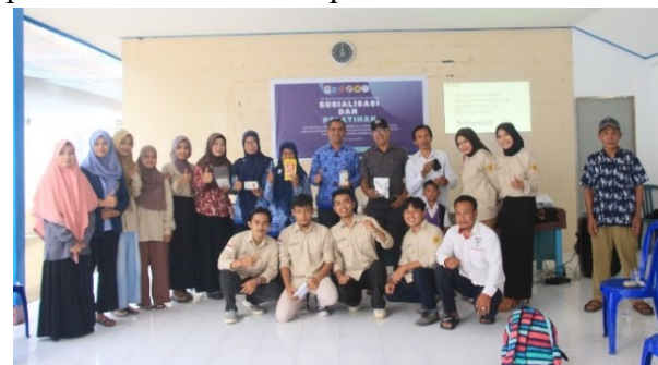
Gambar 1. Pelaksanaan kegiatan sosialisasi teknik pemasaran oleh KKN Tematik Unram dengan bantuan dinas perindustrian dan dinas koperasi UKM

Pada kesempatan ini, dalam rangka memberikan pemahaman terhadap pelaku UMKM Desa Kekait, KKN Tematik Unram mengadakan sosialisasi untuk para pelaku UMKM dalam hal ini bekerjasama dengan Dinas Perindustrian dan Dinas Koperasi UKM sebagaimana yang disajikan pada Gambar 1. Dari hasil sosialisasi tersebut pelaku UMKM menemukan solusi disetiap permasalahan dimulai dari modifikasi kemasan dan teknik pemasaran. Dinas Perindustrian dan Dinas Koperasi Provinsi Nusa Tenggara Barat juga mendukung penuh para pelaku UMKM untuk berani bersaing dengan pelaku UMKM lainnya dengan cara memperbaiki dan memodifikasi kemasan serta membuat legalitas sehingga produk tersebut laku dipasaran.