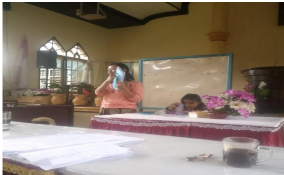
Gambar 2. Kegiatan pembuatan rencana semester dan rencana Tutorial

Kegiatan ini adalah tahap akhir dalam rencana tutorial yang berisi penguatan materi yang telah disampaikan.