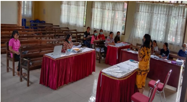
Gambar 2. Kegiatan analisis kurikulum dan objektif masalah yang dilanjutkan dengan pembuatan alokasi waktu.

Hal selanjutnya yang dilakukan adalah membuat alokasi waktu. Pembuatan alokasi waktu dilakukan dengan cara menghitung setiap minggu efektif dalam setiap bulannya. Yang dimaksud dengan minggu efektif adalah minggu dimana dilakukan pembelajaran tatap muka. Dalam pembuatan alokasi waktu ini, setelah perhitungan minggu efektif, maka dilanjutkan dengan perhitungan jumlah tatap muka dalam setiap minggu, dan dilanjutkan dengan perhitungan jumlah jam dalam menyelesaikan pembelajaran. Setelah menghitung minggu efektif didapatkan 24 minggu dengan jumlah tatap muka sebanyak 72 dan 144 jam.