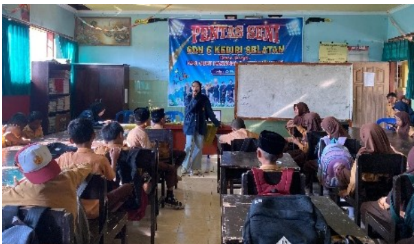
Gambar 2. Penyuluhan Pengaruh Perundungan terhadap Kesehatan Mental

Perundungan merupakan salah satu hal yang dilarang dalam agama Islam, sebagaimana terdapat dalam QS Al-Hujurat ayat 11. Dalam ayat ini Allah mendorong manusia untuk menjauhi sikap negatif yang dapat merusak dirinya sendiri dan orang lain. Allah memerintahkan manusia untuk saling menyambung tali persaudaraan dan tolong menolong (Lismijar, 2016), salah satu upaya untuk menindaklanjuti perintah tersebut adalah dengan cara menghindari diri untuk menzalimi orang lain yang bisa menghancurkan hubungan