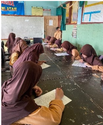
Gambar 1. Pelaksanaan Pre-test dan Post-test

Tujuan kegiatan ini adalah untuk meningkatkan pemahaman siswa terkait kesehatan mental.