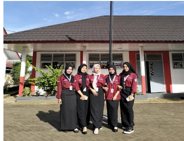
Gambar 1. Pelaksanaan Observasi

bullying yang berjudul “Kana” dengan bertujuan agar mencegah terjadinya tindakan bullying di SDN27 Kota bengkulu , dimana sasaran kegiatan sosialisinya anak kelas 5 dengan jumlah keseluruhan siswa berjumlah 35 orang. Sosialisasi ini di lakukan pada 15 mei 2024 SDN 27 Kota Bengkulu.