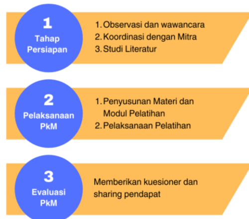
Gambar 1. Tahap pelaksanaan kegiatan

Pelaksanaan pelatihan menggunakan metode direct instruction . Model pembelajaran ini dirancang khusus untuk menunjang proses pembelajaran terkait dengan pengetahuan deklaratif dan pengetahuan prosedural yang terstruktur dengan baik (Suriyani, 2020). Lokasi pelaksanaan kegiatan pengabdian berada di Balai Desa Buncitan, Kecamatan Sedati, Kabupaten Sidoarjo. Tahapan pelatihan ini dapat dilihat dalam diagram berikut.