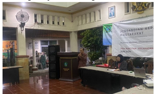
Gambar 2. Sambutan oleh ketua tim PkM

Pelatihan pengabdian masyarakat ini dilaksanakan pada tanggal 7 Juni 2024, dengan jumlah peserta 23 anggota karang taruna Desa Buncitan, dilaksanakan di Balai Desa Buncitan, kecamatan Sedati, Kabupaten Sidoarjo. Sesi pertama dibuka dengan sambutan dari ketua tim pengabdian lalu dilanjutkan dengan materi pelatihan yang pertama yakni mengenai Branding dan pembuatan logo.