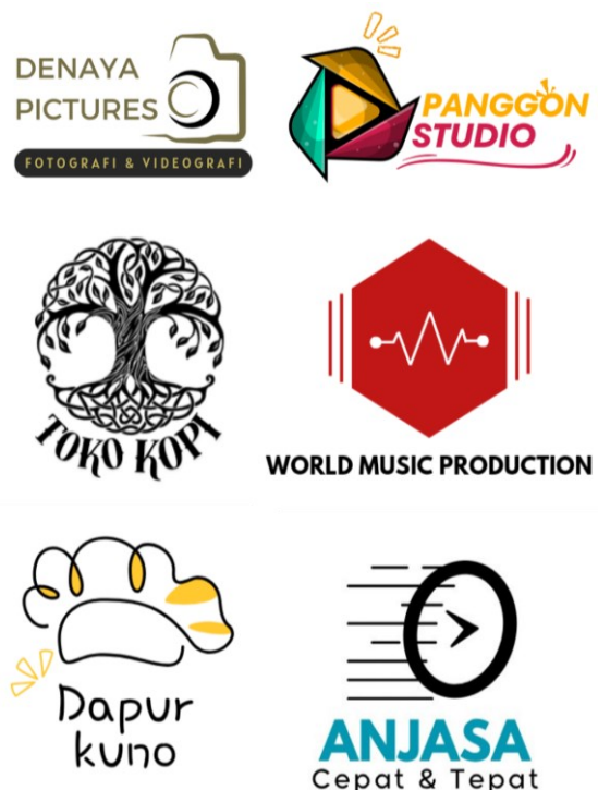
Gambar 8. Hasil karya peserta berupa desain logo UMKM

Hasil karya logo yang dibuat oleh beberapa anggota karang taruna antara lain: