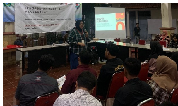
Gambar 3. Pemaparan materi pelatihan sesi Branding dan pembuatan logo