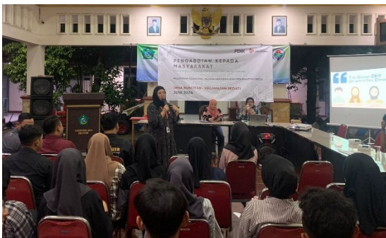
Gambar 4. Proses pelatihan pemaparan materi pelatihan sesi media promosi melalui media sosial

Kemudian pada sesi kedua, dilanjutkan dengan pemberian materi pelatihan mengenai media promosi melalui media sosial. Setelah pemaparan materi usai, peserta diberikan kesempatan untuk mempraktekkan membuat desain logo terkait UMKM masing-masing, yang kemudian logonya diaplikasikan dalam pembuatan media promosi untuk konten media sosial Instagramnya. Peserta dipandu dengan video tutorial dan juga didampingi oleh tim PkM selama proses praktek, agar luaran yang dihasilkan sesuai dengan target dari UMKM tersebut.