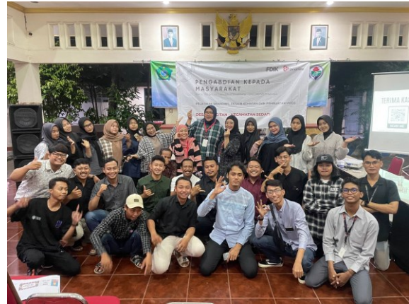
Gambar 7. Peserta Pelatihan dan penyuluh

Setelah menyelesaikan sesi praktek membuat desain logo dan media promosi, peserta diminta untuk unggah hasil karyanya melalui email dan mendeskripsikan konsep dari logo yang telah dibuat untuk selanjutnya diberikan feedback dan review oleh pemateri untuk perbaikan ke depannya. Setelah itu, kegiatan pelatihan ditutup dengan ramah tamah dan sesi dokumentasi foto bersama.