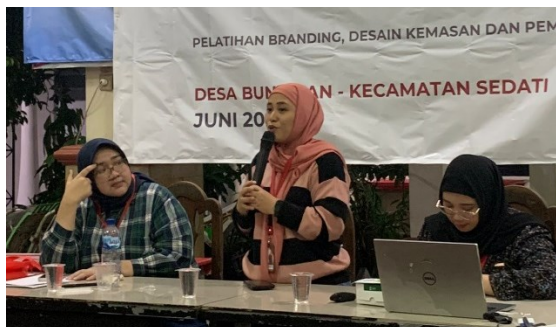
Gambar 5. Proses pemaparan tutorial untuk praktek membuat desain logo dan media promosi