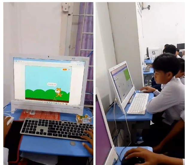
Gambar 3. Proses Pelaksanaan Pelatihan (Pembuatan Game )

Tanggapan peserta didik ketika mengikuti program pelatihan sangat baik. Peserta didik berharap ada lagi pelatihan-pelatihan yang semacamnya. Hal ini menjadi pengalaman pertama peserta didik karena sebelumnya tidak pernah mereka lakukan. Motivasi mereka bertambah dengan keinginan membuat game lain lagi. Hal ini sejalan dengan temuan Nabilah et al (2024) bahwa penggunaan scratch mampu meningkatkan motivasi belajar dan kemampuan berpikir kreatif peserta didik.