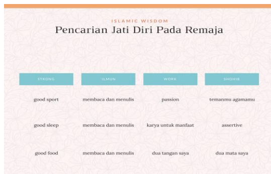
Gambar 3. Slide power point materi kegiatan webinar