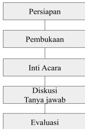
Gambar 1. Langkah-langkah pelaksanaan kegiatan

Metode yang digunakan untuk mencapai tujuan dan target yang diharapkan adalah dengan pemberian materi, diskusi dan tanya jawab. Materi yang diberikan yaitu, definisi pemalas, efek domino dalam kehidupan, Islamic Wisdom dalam pencarian jati diri remaja, kesempurnaan Shalat, dan action plan . Langkah-langkah pelaksanaan kegiatan dapat digambarkan sebagai berikut: