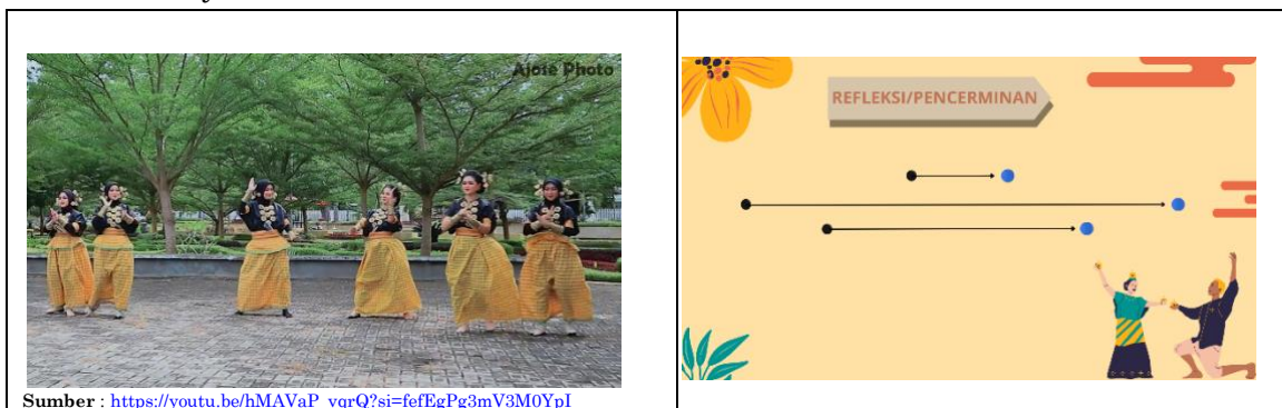
Gambar 1.2 Pola simetris kiri-kanan (Refleksi)

Pada Gambar 1.1, terlihat bahwa penari berpindah posisi secara bersamaan ke arah tertentu. Perpindahan ini dilakukan dengan arah yang sama dan jarak yang relatif tetap, sehingga bentuk susunan penari tidak mengalami perubahan yang berarti. Meskipun posisi mereka bergeser, pola formasi yang terbentuk masih tampak sama seperti sebelumnya.