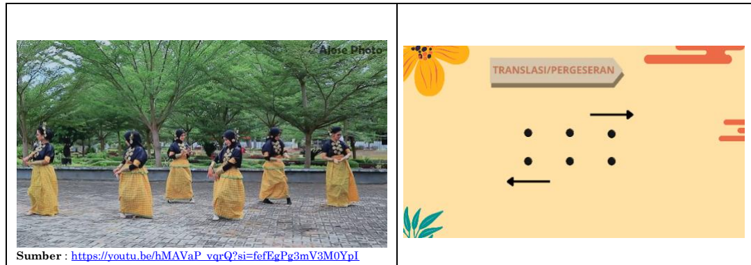
Gambar 1.1 Pola perpindahan penari (Translasi)

Berdasarkan hasil pengamatan terhadap video Tari Lipa' Sa'be yang didukung oleh wawancara dengan pelatih tari, data mengenai pola lantai kemudian diolah dan disajikan dalam bentuk gambar, yaitu Gambar 1.1, Gambar 1.2, dan Gambar 1.3. Penyajian dalam bentuk gambar ini dilakukan agar perubahan posisi dan susunan penari pada setiap tahap gerakan dapat terlihat dengan lebih jelas. Data yang di tampilkan merupakan hasil penyederhanaan dari pengamatan yang telah di lakukan: