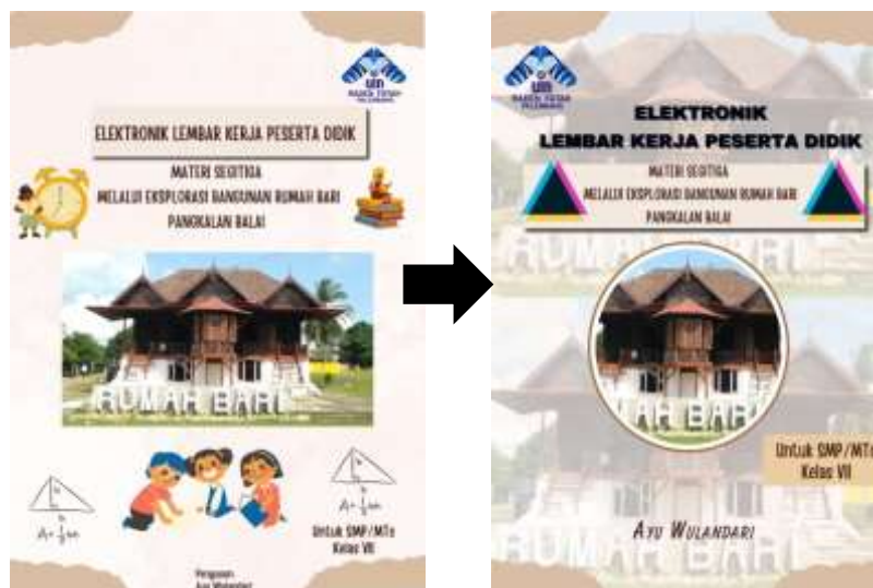
Gambar 2. Prototype awal menjadi protoype 1

yaitu tahap prototyping menggunakan alur formative evaluation . Prototype awal pada tahap desain digunakan untuk tahap self-evaluation . Hasil revisi pada tahap ini menghasilkan prototype 1.